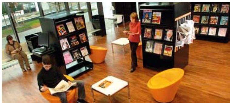
Exemple de Médiathèque

UN LIEU DE RASSEMBLEMENT DES ÉNERGIES AU SERVICE DE LA POPULATION