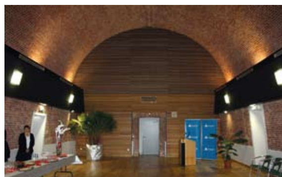
Salle Foch (Grande salle)

Les tarifs des locations sont consultables en Mairie.