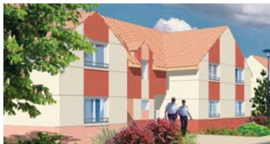
Logement pour les gendarmes

Nos gendarmes méritent des logements décents et de meilleures conditions de travail. Ainsi une nouvelle caserne de gendarmerie était attendue, elle sera composée de 23 logements et sera située dans le quartier de Lenglet. Le projet répond aux exigences des services de gendarmerie et crée un ensemble construit cohérent et fonctionnel.