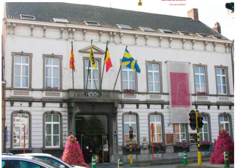
La Mairie d'Harelbeke

Monsieur le Maire a reçu une délégation de la ville de « Harelbeke » mercredi 17 novembre 2010, composée du bourgmestre et des échevins. Lors de cette rencontre, il a pu être constaté qu'Aire-sur-la-Lys avait de nombreux points communs avec « Harelbeke », par exemple, ils disposent d'une Harmonie, ils ont un géant, le Badminton est pratiqué... Une réflexion est menée sur un rapprochement. Très prochainement, le bourgmestre et les échevins viendront rencontrer notre Bureau Municipal et visiter notre Belle Ville d'Aire-sur-la Lys. Puis ensuite, le Bureau Municipal d'Aire-sur-la Lys sera accueilli par les élus d' « Harelbeke ».