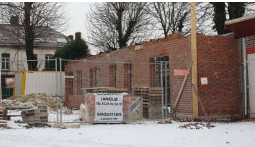
Construction d'un local pour OSA athlétisme

Conscient du manque d'infrastructures pour ce club qui compte de très nombreux adhérents, la municipalité a fait le choix de construire sur le stade Paul Nestier un local qui leur servira de salle de réunion mais aussi de club house.