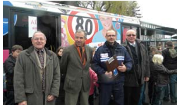
Bus ludique sécurité routière