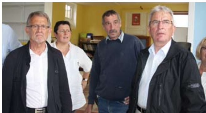
Le bureau Municipal sur le terrain