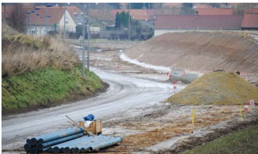
Travaux en cours de réalisation

Des demandes de mise en sécurité de cet axe étroit avaient été soulevées lors de la réunion de quartier de ce secteur. Le Conseil Général y a répondu favorablement et actuellement, les travaux sont en cours. Ils ont débutés par les terrassements courant novembre. Ils reprendront courant janvier 2011 pour se terminer, nous l'espérons en mars 2011. Entre-temps, la municipalité a profité de cette opportunité pour réaliser l'extension du réseau d'eaux usées et la pose d'une conduite d'eau potable jusque l'entrée de St-Quentin pour plus tard réaliser l'assainissement dans ce secteur. Ces travaux sont en cours et devraient se terminer pour les fêtes de fin d'année.