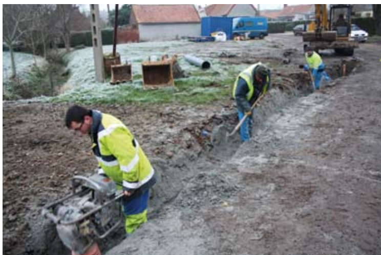
Travaux en cours de réalisation

Lors des prochaines années, les remplacements de conduites d'eau potable vétustes continueront dans d'autres secteurs d'Aire-sur-la Lys.