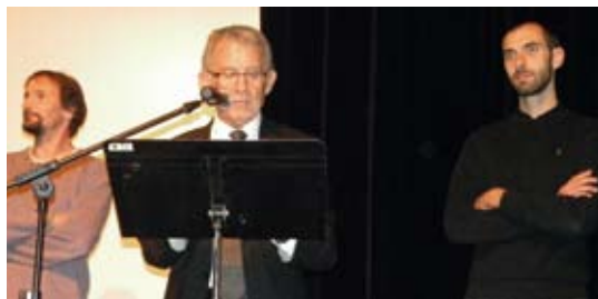
M. le Maire et l'équipe de l'AREA

L'année 2010, marque un changement de cap dans l'activité de l'Espace Culturel AREA. En effet le Cinéma a depuis cet été repris une part importante dans l'activité du lieu. L'Espace Culturel AREA, en partenariat avec l'association Lilloise CinéLigue, a permis de mettre en place 2 projections cinéma en plein air dans les