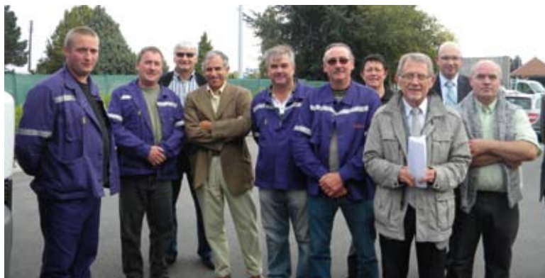
L'équipe municipale et les agents du service technique

Dernièrement, la municipalité a réceptionné un camion multi-usages, apportant beaucoup de commodité au personnel dans la manutention ; véritable outil polyvalent, adapté, à toutes les tâches du service technique. Cette nouvelle acquisition vient renforcer le parc engins des services techniques. Ce véhicule aidera nos agents dans le transport de