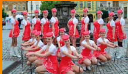
Les Majorettes ZLIN (Tchèques)