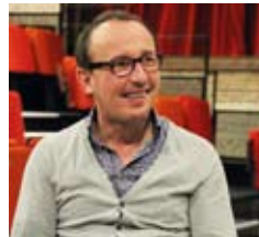
ZEF le samedi 25 février 2014