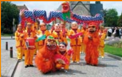
La Maison des Artistes de Pékin

15h30 à 18h15 : Cortège folklorique et zone de parade sur la grand'Place (à partir de 17h)