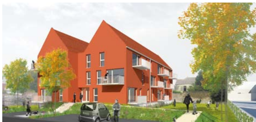
Projet de S.I.A Habitat