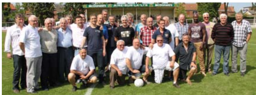
Les 70 ans de l'OSA Football.