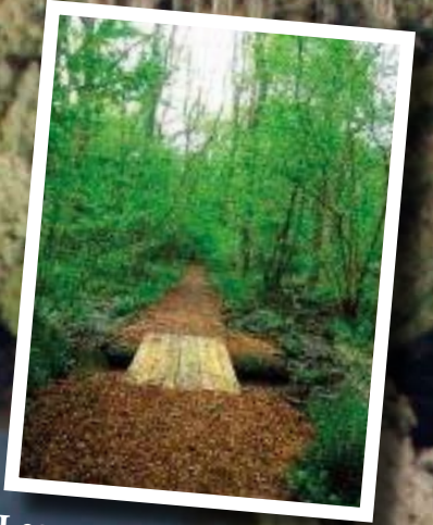
Les passages d'eau