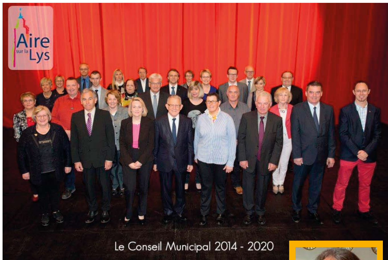
Le Conseil Municipal 2014 - 2020