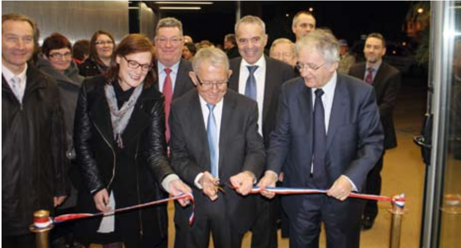
Inauguration en Janvier