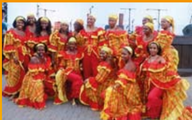
SIGUINES (Folklore Antillais)