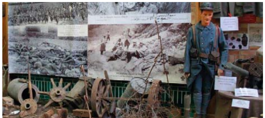
Exposition à Théroüanne