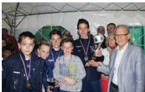
Tournoi de Pâques : les U13 gagnent.