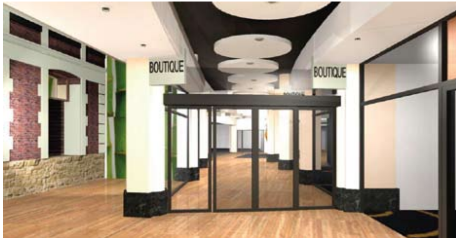
Projet de Galerie

Les travaux de la galerie du Bourg, « future galerie du Bailliage » ; débuteront prochainement et dureront tout l'été.