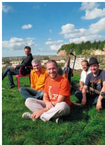
Les Mauvaises Langues