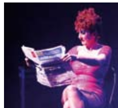
MADO le samedi 29 mars 2014