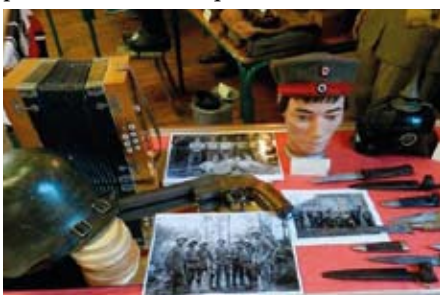
Exposition à Heuringhem

Nord, Aire-sur-la-Lys 1914-1918 », le vendredi 19 septembre 2014, salle de l'Area à 20 heures avec une exposition à la salle Foch qui durera plusieurs semaines.