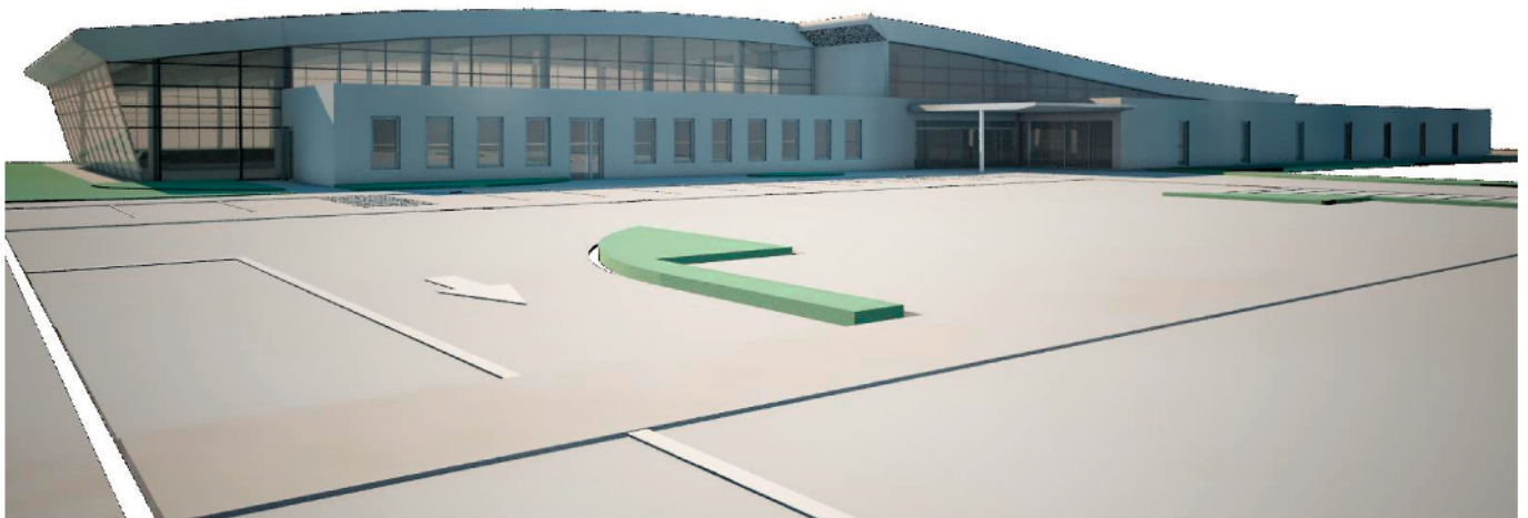
Projet du Centre Aquatique

Les premières baignades pourront être envisagées dès le début de l'été 2016. Avis aux amateurs !