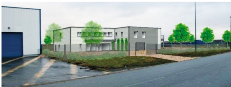
Projet éco bois