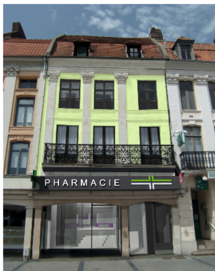
Projet pharmacie Havet