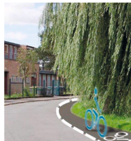
Projet Piste Cyclable Rue Henri Vélaz