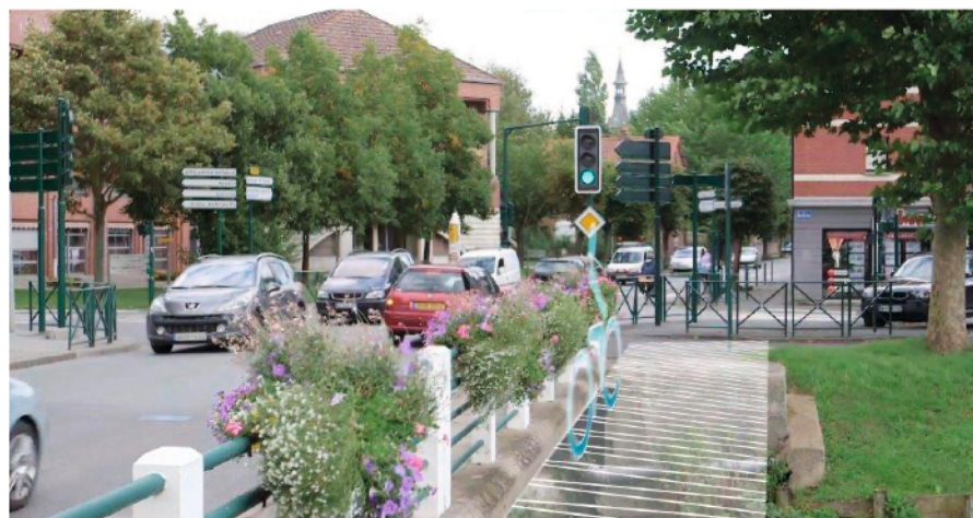
Projet Piste Cyclable Boulevard De Gaulle

de développement de pistes cyclables à travers le Pays de Saint-Omer, et en particulier dans notre ville avec la véloroute voie verte le long de la Lys et les liaisons douces entre centre-ville et hameaux ou vers les établissements scolaires.