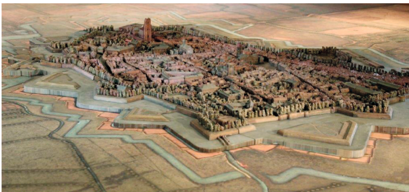
Plan relief réalisé entre 1743 et 1745

Puis, la Société Ingéo, engagée dans un mécénat avec la Région, a réalisé durant un mois le levé numérique en enregistrant les photos en 3 dimensions avant de mettre en œuvre avec une entreprise américaine la restitution en matériaux de synthèse. Dernière étape à venir, la maquette sera transportée à la Chapelle Baudelle pour être le point de