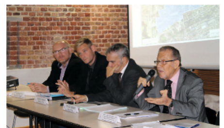
De droite à gauche: M. le Maire, M. le Sous-Préfet, M. le délégué de la ville, l'agence d'urbanisme

Le 3 novembre dernier 25 personnes ont été installées pour siéger au conseil citoyen et ont entrepris leurs premiers travaux consistant notamment à alimenter les éléments de diagnostic qui serviront à la fixation des objectifs auxquels devra répondre le futur contrat de ville.