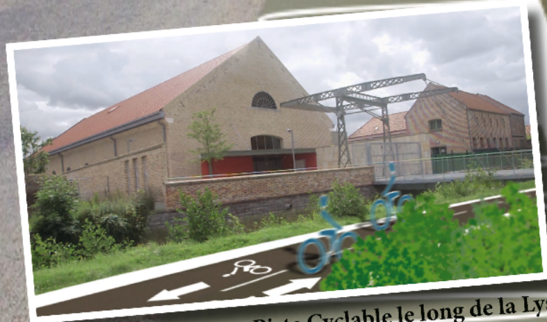
Future Piste Cyclable le long de la Lys

RD 943 - Piste Cyclable qui sera réalisée en 2015 par le Département