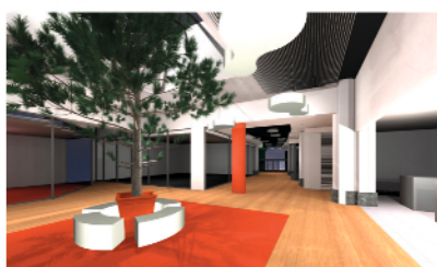
Projet Galerie Carrefour Contact