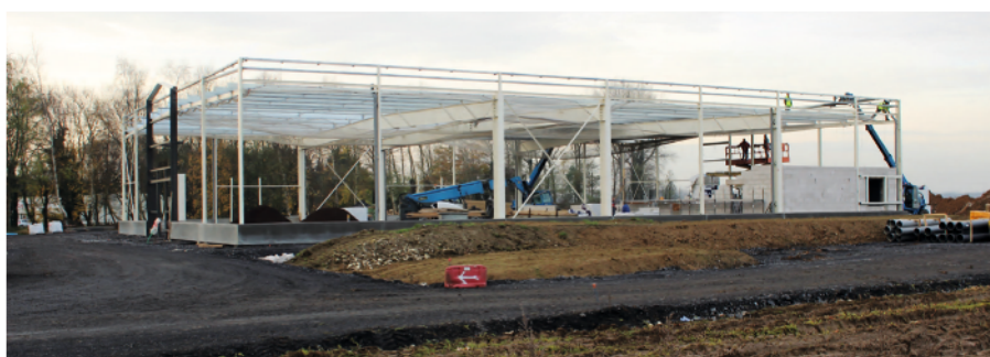
Transfert Gamm Vert Village