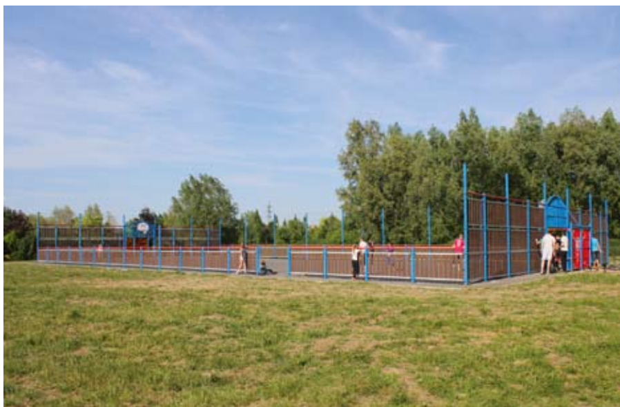
City Stade du Jardin Public