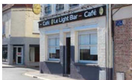
Le Light Bar