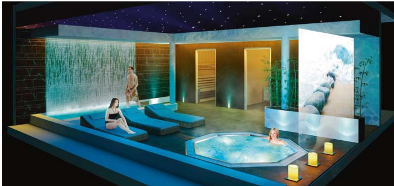
Salle de bien-être

Le projet du futur centre aquatique est enfin sorti de terre.