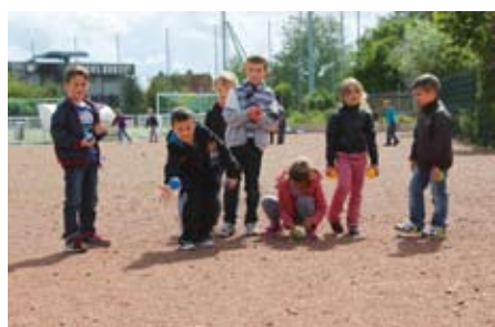
découverte de la pétanque...