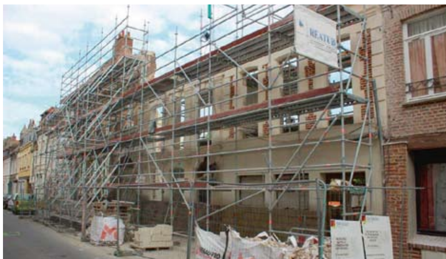
Façade en cours de réhabilitation

Les travaux de façade seraient terminés courant juillet et donc le démontage des échafaudages interviendrait aussitôt.