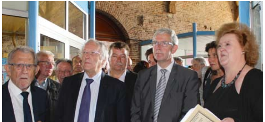
Visite de l'exposition sous les Hallettes

cet événement qui marque la réouverture du Beffroi aux visites de groupe dans un espace rafraîchi et modernisé.