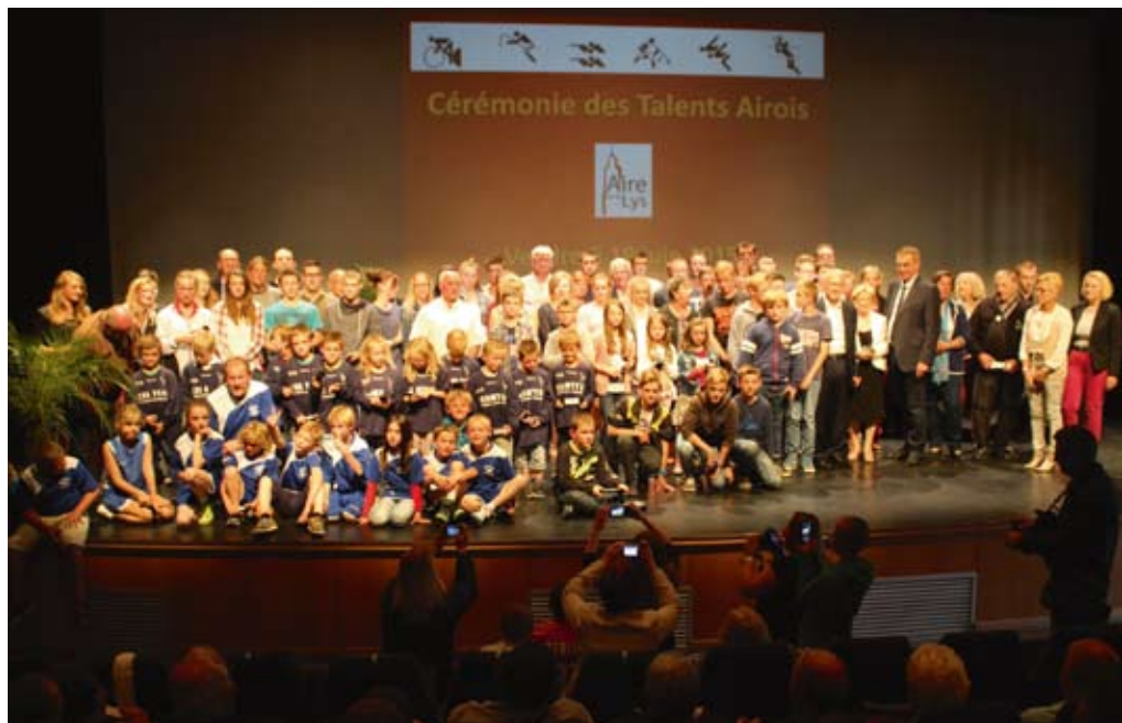
Tous les lauréats avec les élus