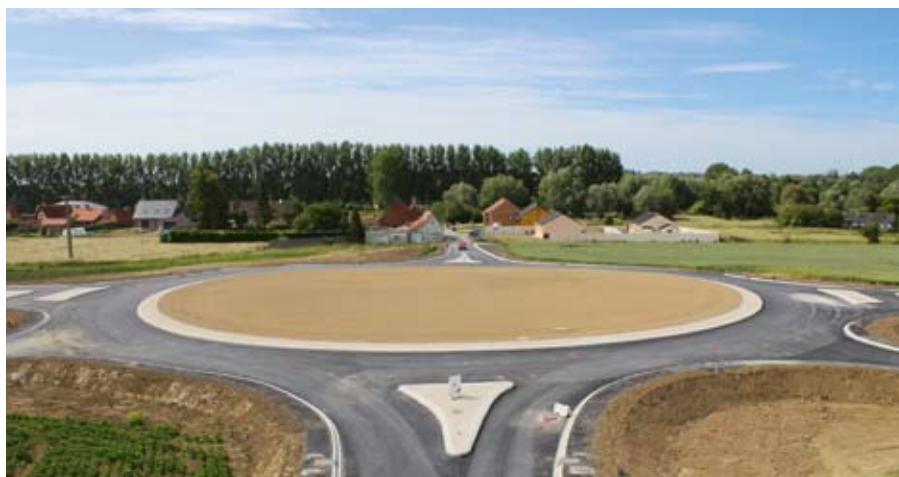
Contournement au bout de la rue du Portugal

Cette section devrait être ouverte à la circulation dès la fin d'année.