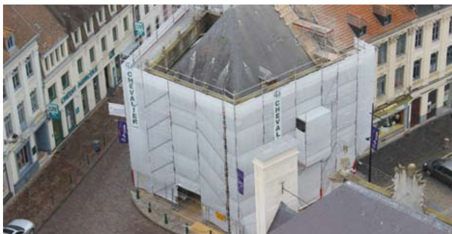
Le Bailliage encapsulé

Pour terminer, est prévue en intérieur une restauration complète des portes et des vitraux. Tout ceci représente une dépense de l'ordre de 420 000 euros largement allégée par diverses subventions de l'Etat, du Conseil Régional et Départemental. Durant cette période, l'office de Tourisme continuera à vous recevoir dans un bungalow situé à gauche de l'Hôtel de ville, près de l'entrée de la galerie des Hallettes.