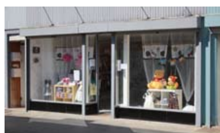
La Boîte à Malices