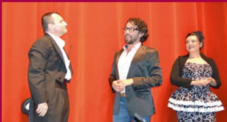
Spectacle Carmen à tout prix