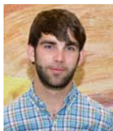
F. Brouard Services Etat Civil, Communication et Animations commerciale de la ville