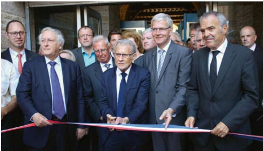
Coupure du ruban