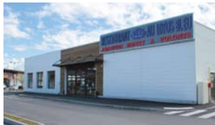
Le Lotus Bleu