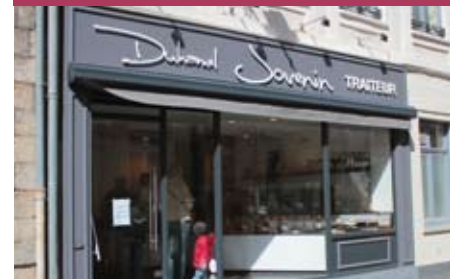
Duhamel - Jovenin