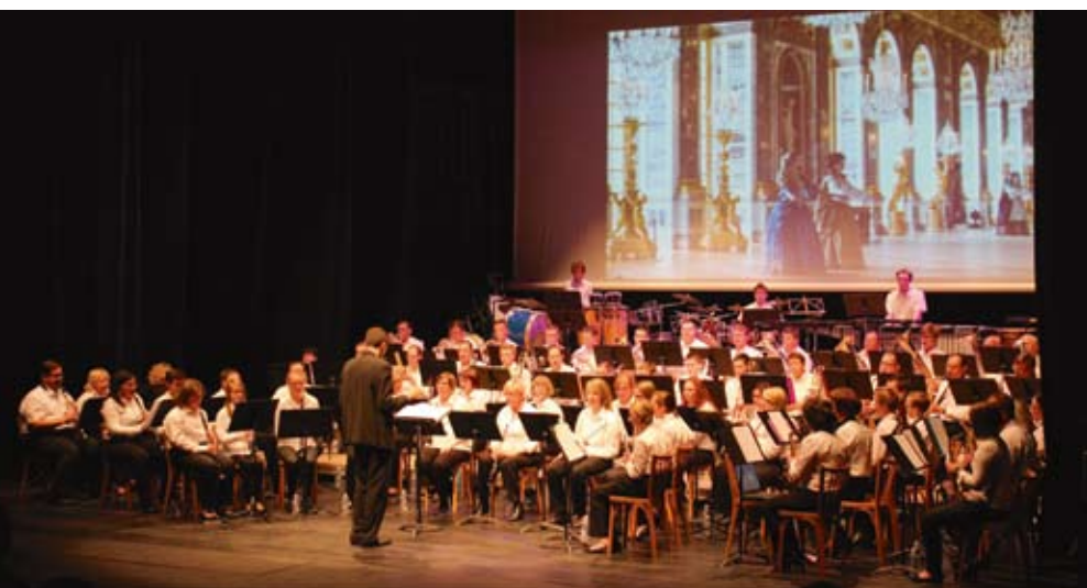
Concert de l'Harmonie-Batterie Municipale d'Aire-sur-la-Lys

Fondée en 1795, l'Harmonie Batterie Municipale d'Aire-sur-La-Lys est la doyenne des sociétés musicales de la région. Forte d'une centaine d'exécutants, elle est classée à ce jour en division d'excellence et, récemment, à l'occasion de son concert annuel, elle a encore pu régaler les nombreux mélomanes. La salle du Manège était encore pleine pour apprécier un répertoire éclectique, pimenté d'intermèdes savoureux.