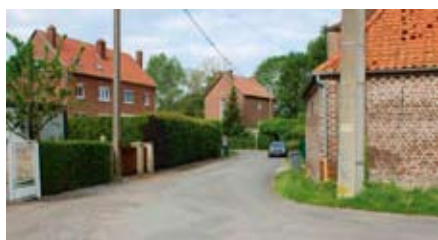
Rue de Merville

L'aménagement de l'impasse rue de Merville a débuté. Les travaux vont consister en un terrassement en élargissement, empierrement, pose de bordures et caniveaux, la création de bouches d'égout et réalisation de trottoirs. La chaussée sera renforcée par la mise en œuvre de grave bitume suivie d'une couche de roulement en enrobés. Ce même type de chantier commencera début juillet sur une section du chemin de Widdebrouck.