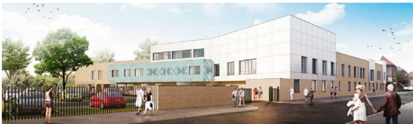
Projet du futur Centre Hospitalier

ENFIN après bien des pérégrinations et avec la persévérance de M. le Maire, le permis de construire du nouvel hôpital sur