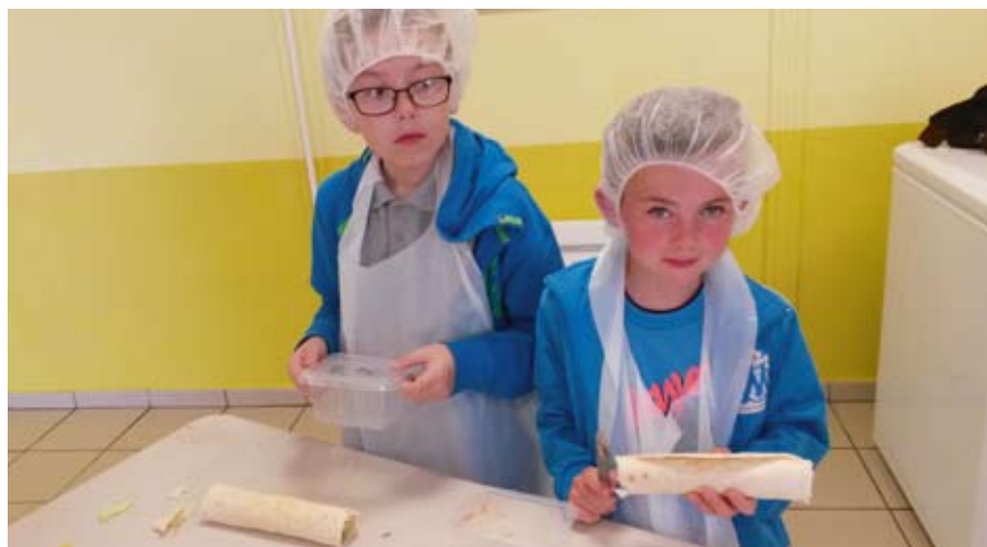
Atelier cuisine, mais aussi...