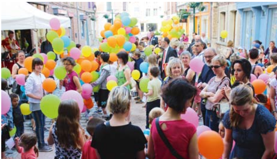
Lâcher de ballons par les enfants des écoles