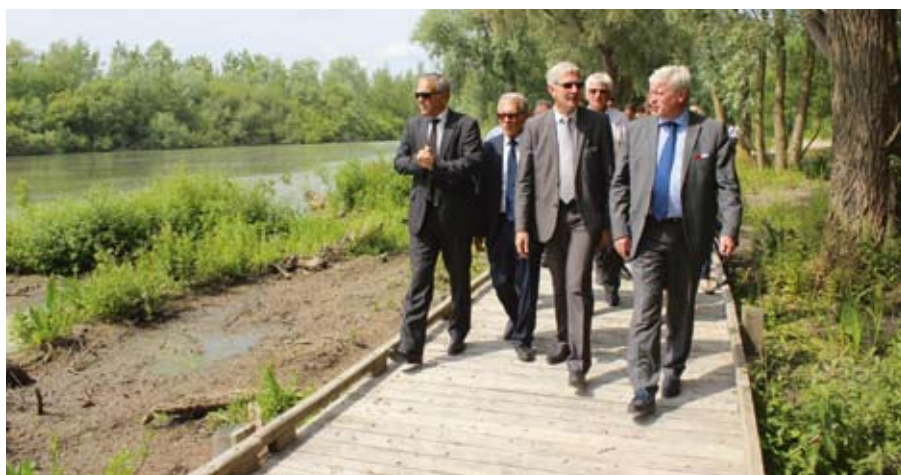
Balade dans l'espace Naturel sensible