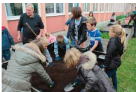
du jardinage et bien d'autres