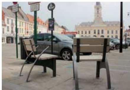
Dans le centre ville

La Municipalité a décidé de renouveler le mobilier urbain vieillissant en certains endroits de la ville. La commission s'étant réunie, nous avons pour projet de changer les bancs et d'en augmenter le nombre sur notre territoire.