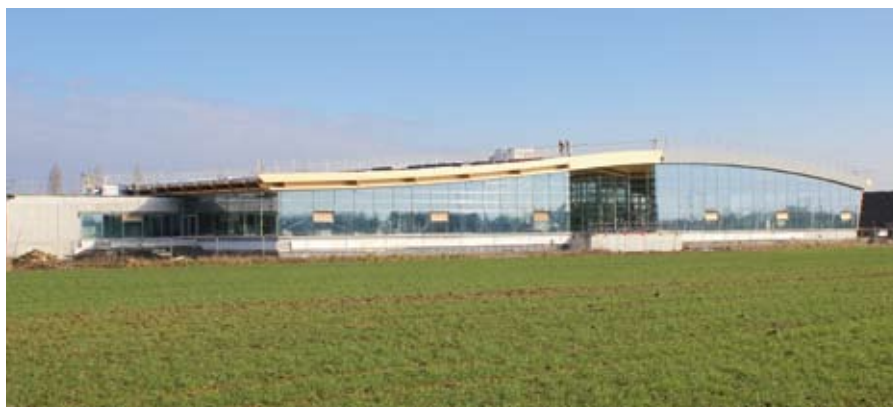
Centre aquatique en cours de finalisation

Ce dernier sera désigné courant septembre 2016, pour une durée de 6 ans, permettant ainsi une ouverture au public d'ici à la fin du mois de septembre prochain.