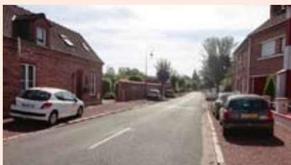
Rue du Mardyck aujourd'hui et le projet d'aménagement

Le coût du projet est estimé à 400 000€, sur un linéaire de 200m.