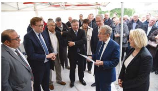
Pose de la 1 ère pierre

En 2017, le Centre Hospitalier ouvrira son nouvel EHPAD et débutera la restructuration du bâtiment principal. Cette restructuration en 3 phases (construction et ouverture du nouvel EHPAD en 2017, restructuration du bâtiment existant en septembre 2017 et en octobre 2018) se déroulera jusqu'en 2019.