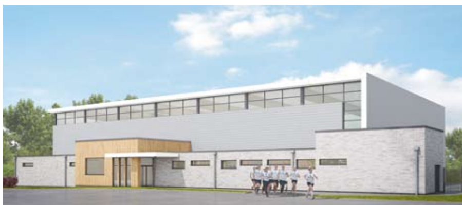
Projet de la future salle de sport

pratique du handball, basket, volleyball, et tennis. Elle sera composée d'un hall d'entrée, d'une salle de réunion pour les associations, de vestiaires / Sanitaires et de nombreux rangements pour les associations. Les travaux débuteront à la fin de l'année 2016, pour une durée prévisionnelle de 14 mois.