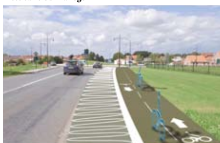
Piste vers le barreau des alliés