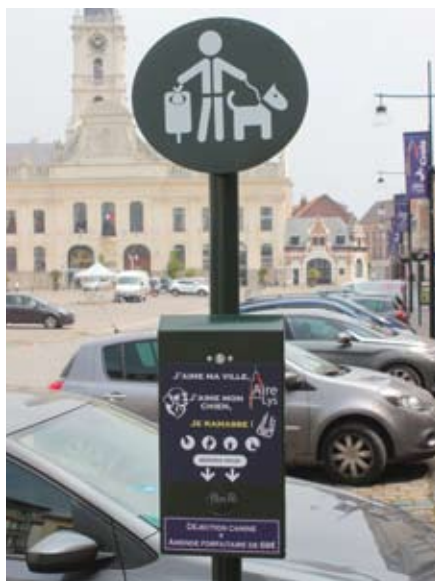
Distributeur de sachets

promener ! La municipalité a pris un arrêté stipulant que toute personne qui ne sera pas en possession d'un sachet pour ramasser les déjections de son chien pourra être verbalisée. Ce programme d'amélioration de notre cadre de vie va se poursuivre cette année encore avec l'installation de nouveaux bancs, distributeurs de sachets, poubelles sur un territoire plus élargi.