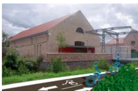
Piste salle du manège

Tout cela s'inscrit dans le schéma de « AIRE Ville cyclable », projet mené en plusieurs années.