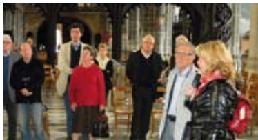
Remise d'un tableau à la Collégiale.

Depuis plus de 15 ans, au cours du mois de septembre, la ville d'Aire-sur-la-Lys s'associe au Ministère de la Culture pour l'organisation des Journées du Patrimoine. Cette année 2011, n'a pas dérogé à la tradition et, avec la coordination assurée par l'office de Tourisme, le programme des 17 et 18 septembre s'est fortement étoffé et a satisfait un large public, pour une grande partie, extérieur à la ville.