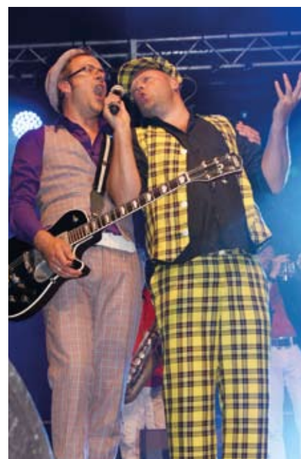
Hermes House Band.