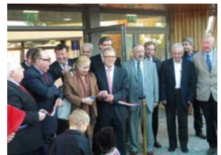
L'inauguration le 14 octobre 2011