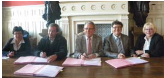
Signature avec Quiestède - Inghem

dans les délais les plus brefs ce qui permet de gagner beaucoup de temps dans les transactions terrains - permis de construire et vente d'immeubles existants. Le service urbanisme d'Aire-sur-la-Lys a traité environ 570 actes en 2010, c'est un service de proximité réactif.