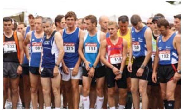
Courses pédestres de l'OSA Athlétisme.