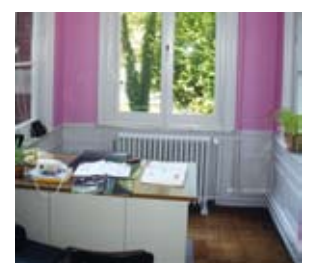
Bureau de permanence.