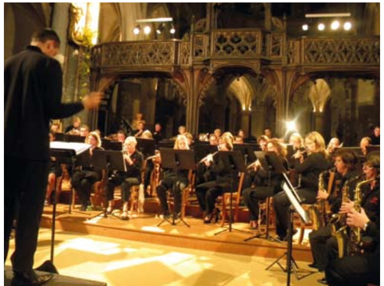
Concert de l'Harmonie Municipale.