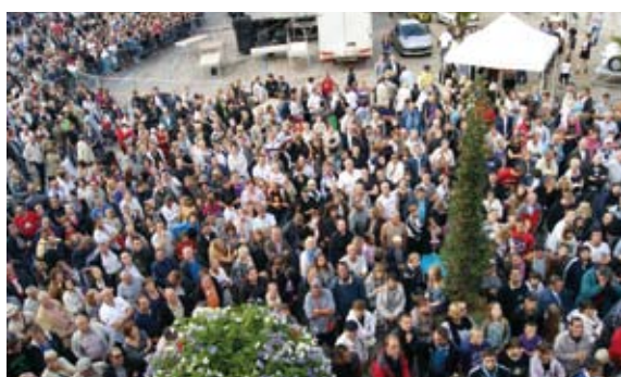
Une foule nombreuse pour le jet de l'andouille.