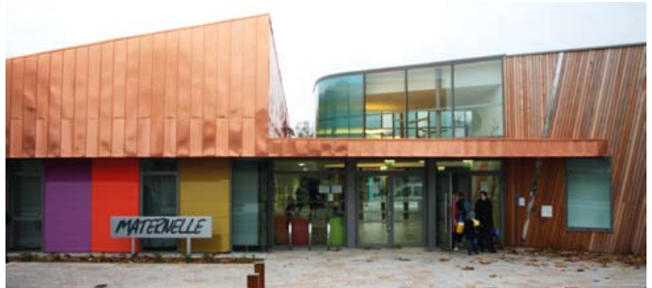
Entrée de l'école maternelle

En 2007, l'école maternelle du centre située rue du Fresno avait été transférée à l'annexe Vauban pour raisons de sécurité. Les enfants ont intégré la nouvelle école nouveau quai à la rentrée de septembre. Cette école jouxtant un multi-accueil étant agréé par la Protection Maternelle Infantile pour 30 enfants à compter de janvier et 20 actuellement. Il regroupe aussi le RAM (relais d'assistantes maternelles) et le Roul'boutchou (halte garderie itinérante).