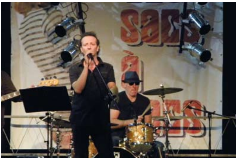
Le groupe sacs à sacs.

Le samedi soir, la municipalité a organisé un repas dansant à la salle du manège où les 300 convives ont dégusté la « potée Airoise » avant de danser sous les rythmes du groupe belge « sacs à sacs » de la ville d'Harelbeke.