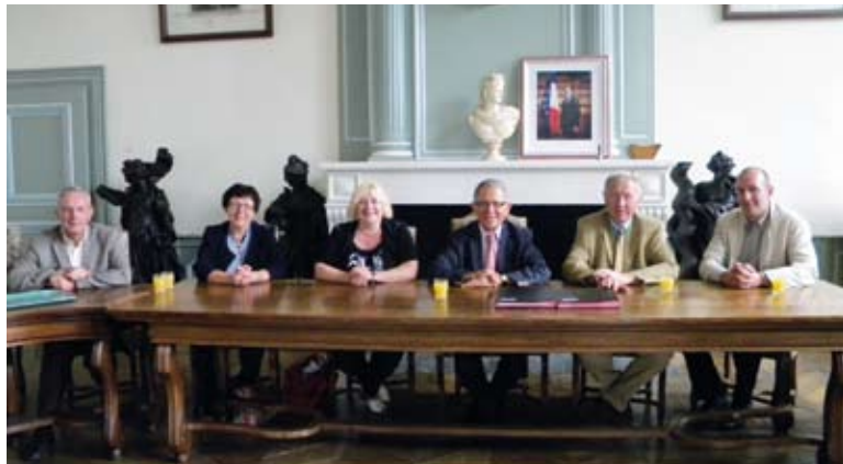
Signature avec Wittes.

Notre ville d'Aire-sur-la-Lys a créé son service d'instruction des actes d'urbanisme en 2009, et a proposé aux communes qui le souhaitent de nous rejoindre. Cinq communes : Ecques, Inghem, Quiestède, Wittes et aujourd'hui Delettes ont adhéré à ce service. Le bureau de l'urbanisme, situé rue de Saint-Martin, dans les locaux des Services Techniques reçoit le public tous les jours et assure une mission de conseil et d'aide à la réalisation des projets. Les actes d'urbanisme : certificats d'urbanisme, permis de construire... y sont instruits