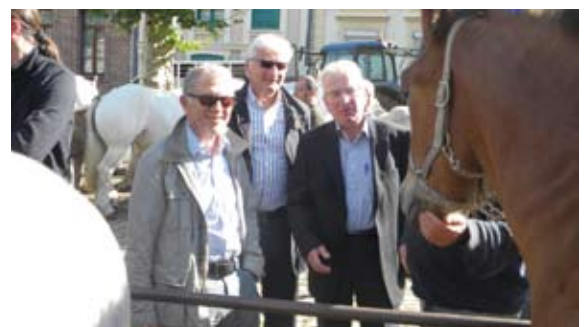
Foire aux chevaux.

Réussir l'exploit de rassembler un tel échantillonnage de l'offre locale en tous domaines démontre de manière éclatante les ressources et le savoir-faire de nos commerçants, artisans et producteurs, même si certains viennent, attirés par le renom de la foire, d'horizons plus lointains.