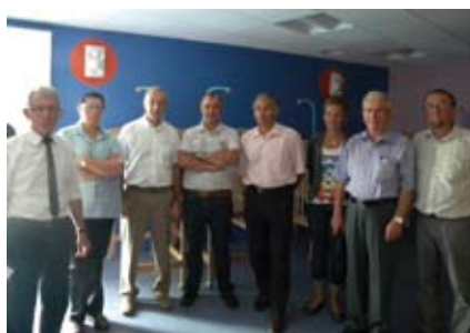
Visite du pôle petite enfance qui jouxte la nouvelle école maternelle, rue du nouveau Quai.