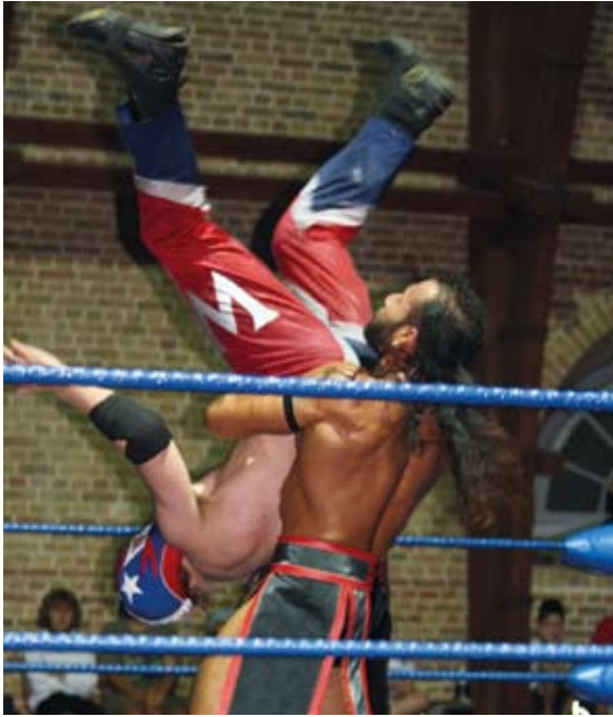
Gala de Catch.

Tout a commencé le Vendredi 2 septembre à la salle du manège avec le Gala de Catch, spectacle de « haute voltige » toujours très apprécié des enfants et des parents. Cet événement est ancré depuis de nombreuses années en tant qu'ouverture des festivités du Festival de l'Andouille.