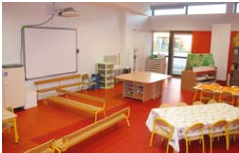
Salle de classe équipée de T.B.I.