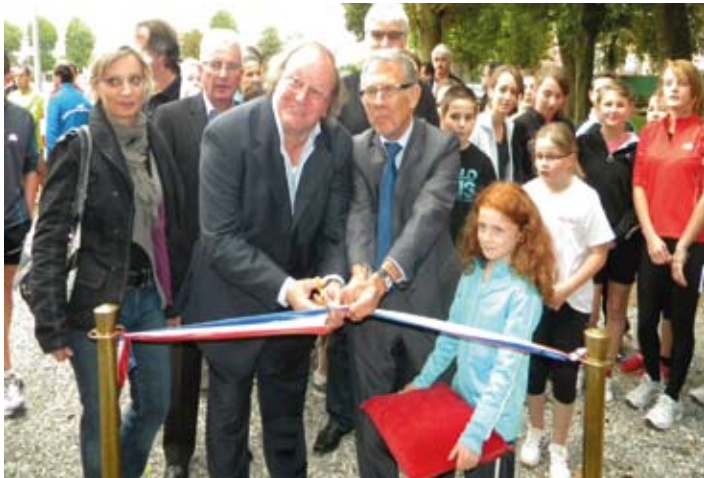
Inauguration du local.

Depuis de très nombreuses années, le club qui compte parmi les plus importants au nombre de licenciés attendait un local faisant fonction de salle de réunion et de club house. C'est chose faite depuis l'inauguration et la signature d'une convention d'utilisation qui ont eu lieu le mercredi 21 septembre 2011. Les travaux ont débuté en août 2010 et ont été réalisés pour le gros œuvre par l'APRT d'Esquerdes, association qui permet la réinsertion des jeunes. Couverture, électricité et sanitaire ont été confiés à des entreprises locales. Les services techniques de la ville ont quant à eux, réalisé les travaux de carrelage et de peinture.