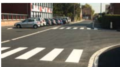
Rue Jean-Jaurès après les travaux

Visite de l'école de Rincq où les services techniques ont réalisé une dalle béton et la pose de carrelages avec au préalable la démolition de l'existant. En finition, toutes les peintures ont été faites.