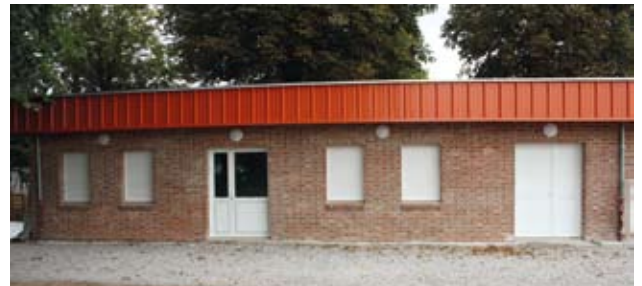
Vue extérieure du local.

Depuis de très nombreuses années, le club qui compte parmi les plus importants au nombre de licenciés attendait un local faisant fonction de salle de réunion et de club house. C'est chose faite depuis l'inauguration et la signature d'une convention d'utilisation qui ont eu lieu le mercredi 21 septembre 2011. Les travaux ont débuté en août 2010 et ont été réalisés pour le gros œuvre par l'APRT d'Esquerdes, association qui permet la réinsertion des jeunes. Couverture, électricité et sanitaire ont été confiés à des entreprises locales. Les services techniques de la ville ont quant à eux, réalisé les travaux de carrelage et de peinture.