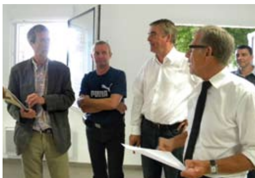
Visite du local de l'O.S.A Athlétisme au stade Paul Nestier.

Visite de chantier de la rue Jean-Jaurès. Les travaux d'aménagement ont commencé début juillet pour se terminer fin août. Depuis cette date les travaux d'effacement des réseaux aériens sont en cours. Ils devraient être terminés pour la fin novembre après quoi seront réalisés les enrobés de trottoirs pour terminer l'ensemble.