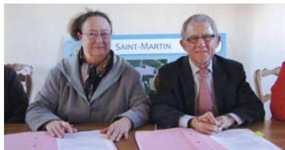
Signature avec Delettes.