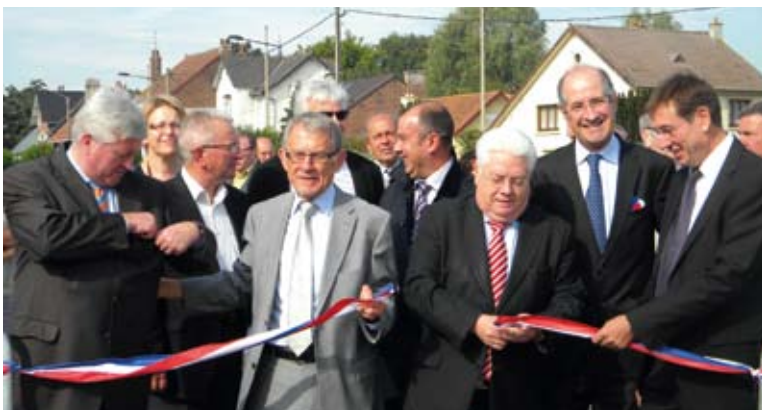
Inauguration de la foire commerciale.