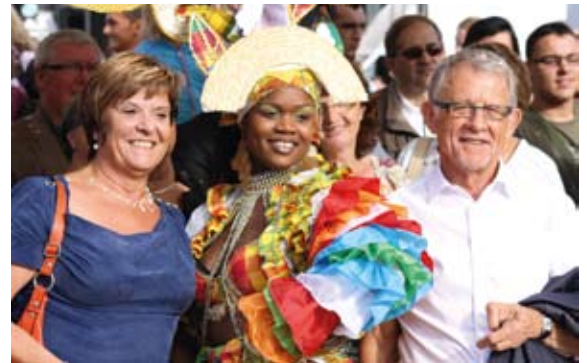
M me la Bourgmestre d'Harelbeke et M. le Maire.