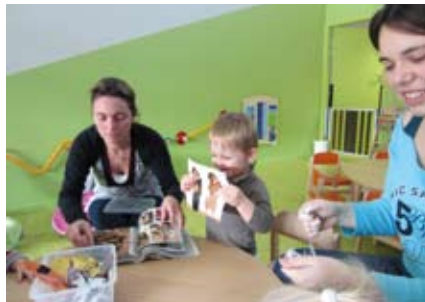
Activité au point d'accueil