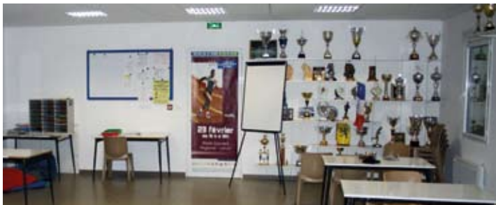
Intérieur du local.