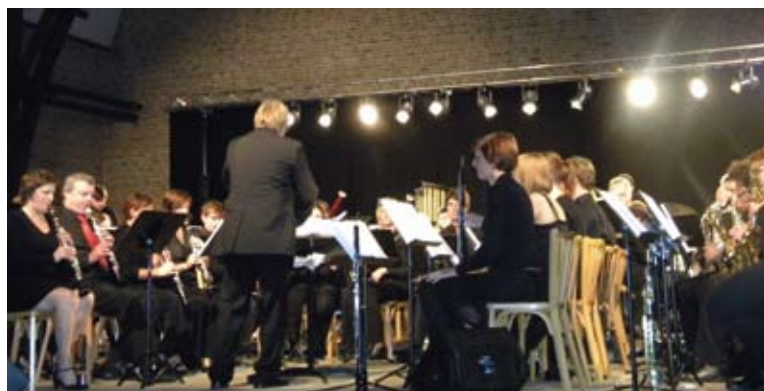
L'orchestre « Vooruit ».

Pour clôturer ces 5 jours de fête, un concert était organisé le mardi 6 septembre à la salle du manège où se produisait l'orchestre d'harmonie belge « Vooruit » dont la réputation dépasse les frontières de l'Europe... Les nombreux mélomanes présents ont vécu des moments inoubliables.