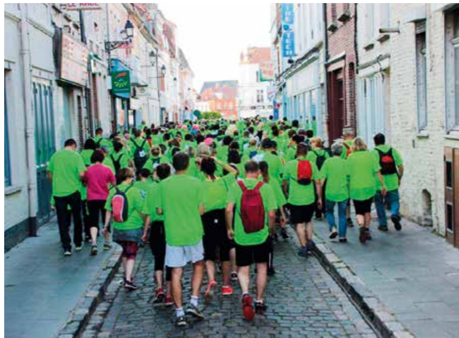
Départ des marcheurs