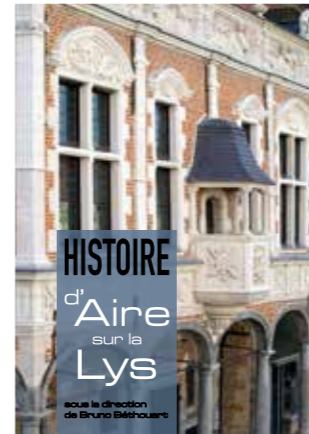
Couverture du livre

Renseignements à la bibliothèque patrimoniale, au 03 21 95 40 42.