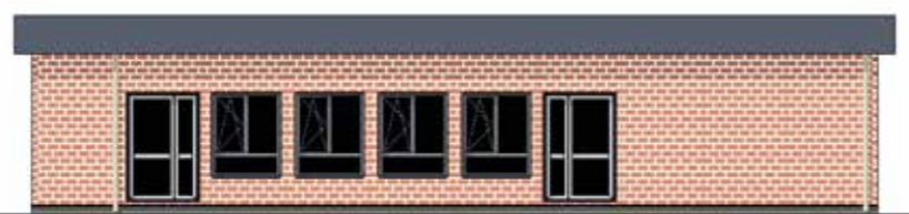
Projet de la future salle polyvalente