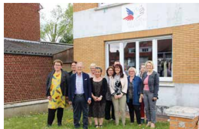
Quelques élus avec les bénévoles

Nous avons visité leur installation et avons rencontré des bénévoles ravis de pouvoir encore proposer leurs services aux plus démunis.