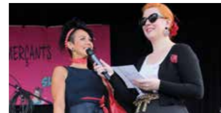
Concours de Pin Up