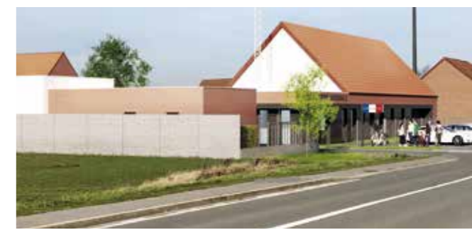
Projet de la future gendarmerie

Nous l'attendions désespérément, le permis de construire pour les nouveaux locaux de la gendarmerie est déposé après avoir reçu l'aval du Ministère de l'intérieur et la DDTM est chargée de son instruction. Nous espérons une acceptation rapide de ce projet afin que nos gendarmes soient mieux logés et aient un cadre de travail fonctionnel ce qui n'est pas le cas actuellement. Le projet situé au bout de la rue Portugal comprend les locaux de la brigade et 25 logements que nous avons fait modifier pour qu'ils aient un garage et soient agréables à vivre pour leur famille.