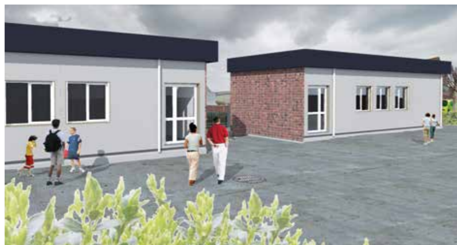
Projet des classes de Jules Ferry

La municipalité tient à ce que les hameaux ne soient pas délaissés et met tout en œuvre pour qu'il y fasse bon vivre.