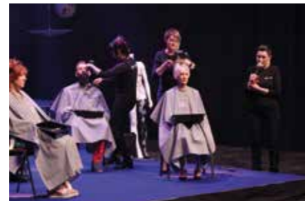
Show de coiffure