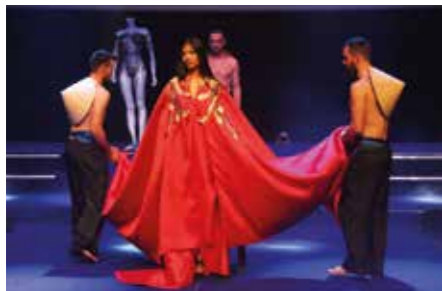
Défilé de mode