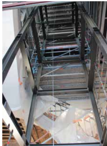
La cage du futur ascenseur

C'est toujours pour mieux vous accueillir que les travaux de mise en accessibilité de l'hôtel de ville sont en cours de réalisation depuis janvier 2019, pour une durée de 10 mois. Les travaux concernent la mise en accessibilité pour les personnes à mobilité réduite, par la mise en place d'un ascenseur panoramique, desservant le 1 er étage (bureaux de la direction), ainsi que le 2 ème étage (bureau du Maire et des adjoints). Celui-ci permettra également de desservir les combles, actuellement inexploités pour le manque d'accès jusqu'à présent. Ces travaux concernent également le réaménagement des bureaux du 1 er étage ainsi que du 2 ème étage. En effet, le plancher a été renforcé, et la disposition des bureaux a été revue.