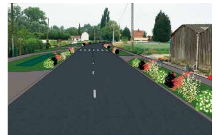
Photo du projet

Des travaux d'assainissement pluvial ont commencé en 2018 entre l'Ave Maria et la sortie de Grand Neufpré. Après une interruption durant la période hivernale, ces travaux ont repris en avril et se sont terminés en juin. Dans le même temps une étude globale entre l'Ave Maria et le pont de Thiennes concernant l'assainissement pluvial, la borduration et l'aménagement des trottoirs a été finalisée et sera réalisée par tranches sur une durée de deux ans. Le département accompagnera le projet pour tous les travaux de chaussée proprement dits. Cette année les travaux de borduration, création de trottoirs et revêtement chaussée reprendront cet été pour une durée de trois mois sur la section comprise entre l'Ave Maria et la sortie Grand Neufpré ce qui permettra de terminer cette zone dans sa globalité, premier maillon de l'aménagement de la RD 194.