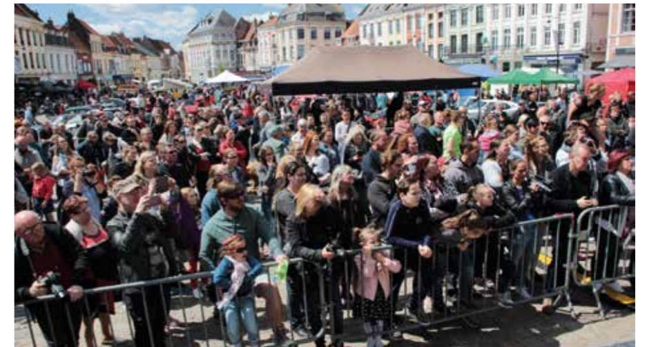
Des concerts appréciés et un public ravi

Une deuxième édition est en préparation pour l'année prochaine.