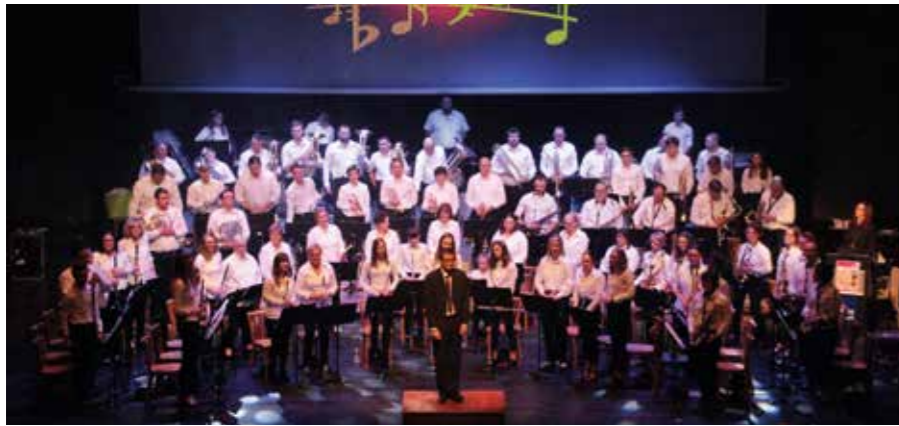
Musiciens de l'harmonie