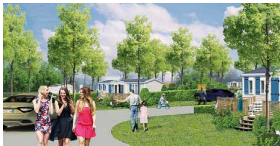
Photo d'un projet en 3D

Un réaménagement du camping situé près du bassin des Quatre Faces est en cours. Les travaux ont commencé début janvier pour se terminer fin juin. L'ouverture aura lieu le 1 er juillet 2019. Les services techniques de la ville ont réalisé une partie des travaux en règle (nettoyage des parcelles, pose du réseau eau potable, assainissement, électricité, wifi, éclairage public, rénovation des sanitaires et création d'un local technique). La création de l'aire des camping-cars d'une capacité de dix places avec point de vidange, bornes électriques, engazonnement ont été confiés à une entreprise.