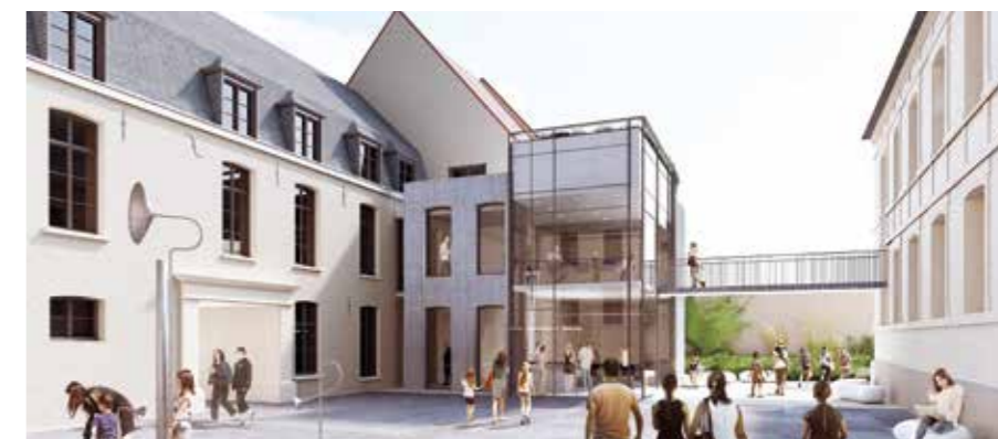
Cour d'accès de la Médiathèque

Encore un beau projet qui se concrétise.