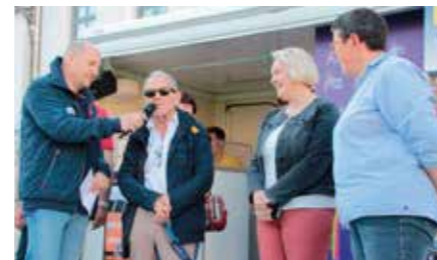
M. le Maire a donné le premier départ

Une 2 ème édition est déjà programmée pour l'année prochaine.