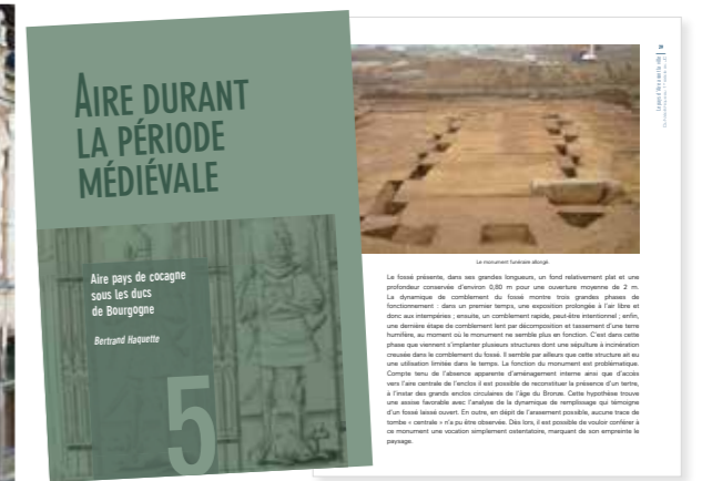
Pages intérieures du livre