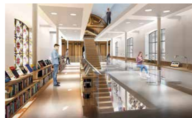
Intérieur de la Médiathèque