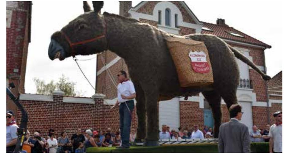
Le bodet d'Estaires