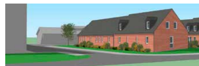
Maisons individuelles T3