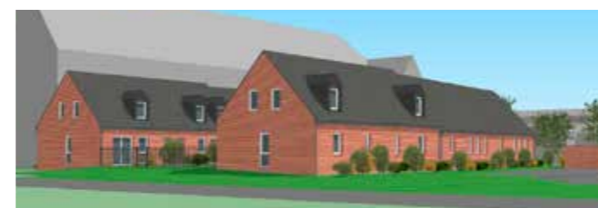
Projet du lotissement

Après maints projets, nous avons donné notre accord sur le projet de réalisation des 8 logements du boulevard de la Manutention et le permis de construire devrait être déposé sous quinze jours. Ce sera une belle réalisation très attendue.