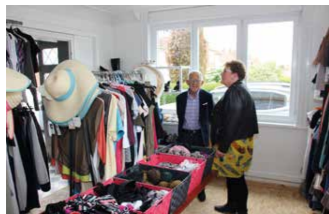
Visite de M. le Maire avec la présidente