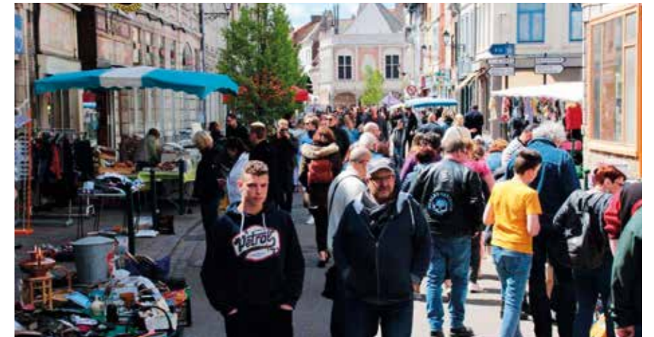
Braderie de la Porte d'Arras