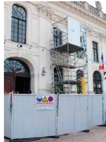
L'hôtel de ville en travaux