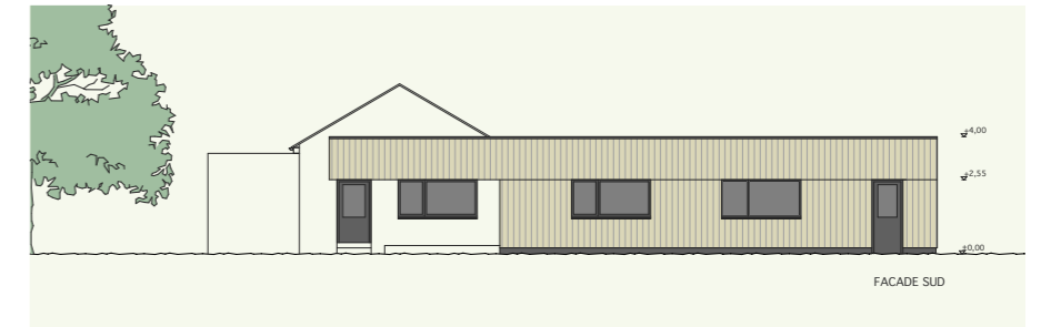
Photo du projet

Le local du boulo-drome situé rue Poincaré devient trop exigu vu l'augmentation du nombre de joueurs. Durant l'année 2019 un nouveau bâtiment sera accolé perpendiculairement à l'existant ce qui permettra de doubler le nombre de couloirs de jeu. Dans le local actuel, l'électricité, le chauffage seront refaits et le club house sera déplacé pour permettre une liaison entre les deux structures. Des travaux de peinture termineront l'ensemble.