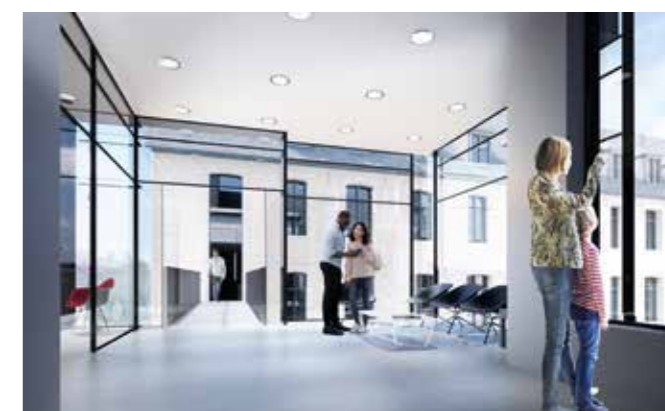
Hall d'accueil de la Médiathèque