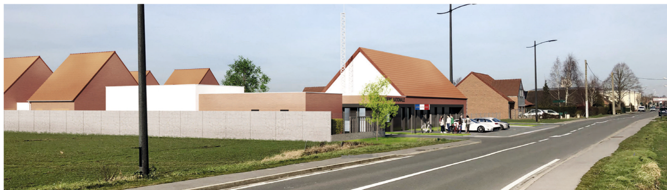
Projet de la future gendarmerie

A LA RENTRÉE, L'HOPITAL SAINT-JEAN BAPTISTE VA SE TRANSFORMER