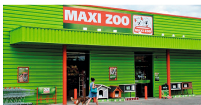
Maxi Zoo - Ouverture la 29/07/2020