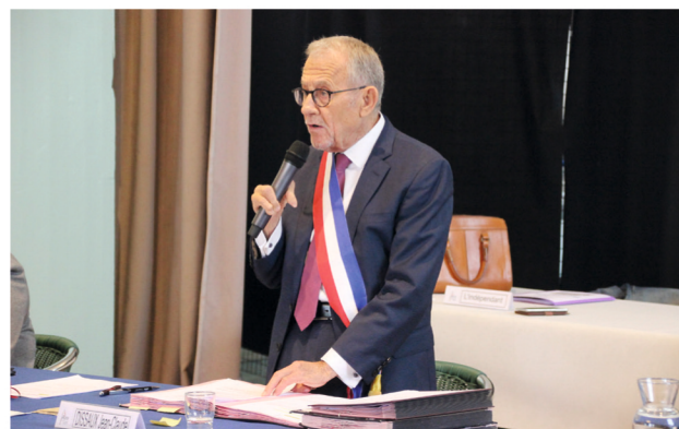
M. le Maire prononce son discours d'introduction

C'est au sein de la salle de l'Amitié et à huis-clos, état d'urgence sanitaire oblige, qu'à eu lieu le samedi 23 mai, dès 8h30, l'installation du nouveau Conseil Municipal.