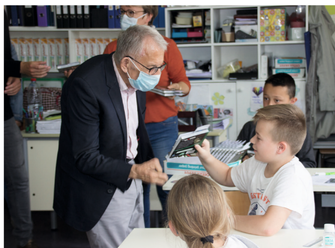
M. le Maire remet un livre

Chaque année la remise des prix se déroule lors de la fête des écoles. Cette année, Monsieur le Maire a souhaité maintenir cette tradition en allant dans les écoles avec les représentants élus de chaque école. Les enfants étaient ravis d'avoir un livre. Certains ont dit « je vais le lire pendant les vacances ». Pour les CM2, ils ont eu également un dictionnaire, un livre de cuisine ou un atlas.