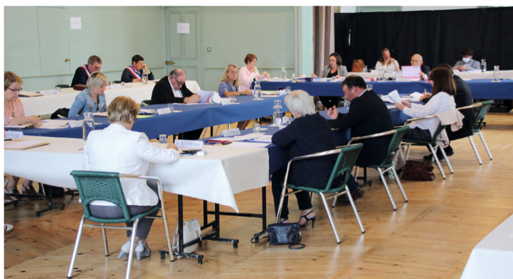
Une installation exceptionnelle salle de l'Amitié