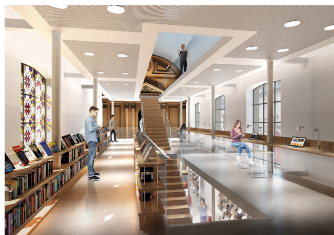
Intérieur de la médiathèque

A LA RENTRÉE, L'HOPITAL SAINT-JEAN BAPTISTE VA SE TRANSFORMER