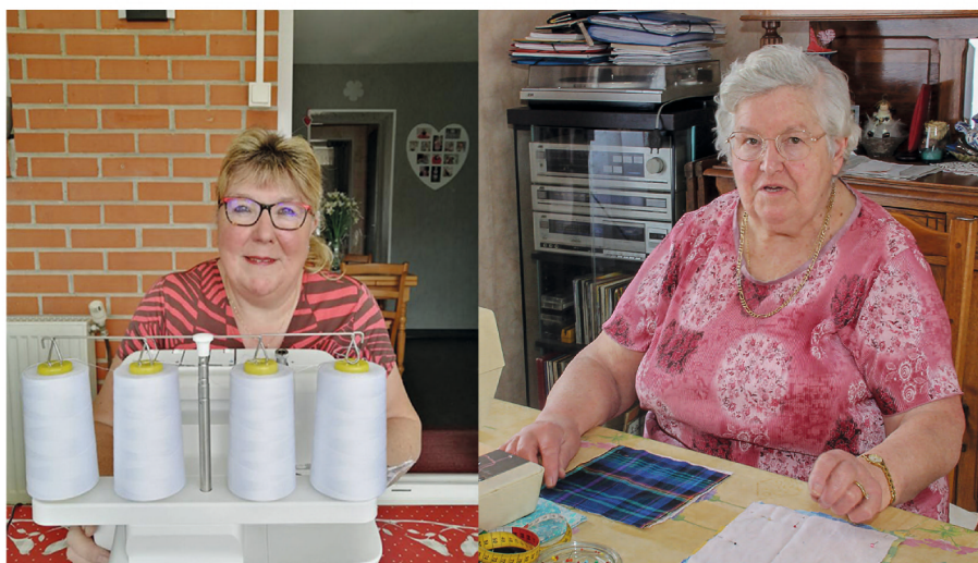
Des couturières bénévoles