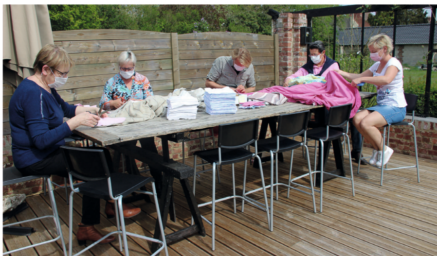
Des élus en action

Monsieur le Maire a souhaité remercier tous les bénévoles par un petit cadeau.