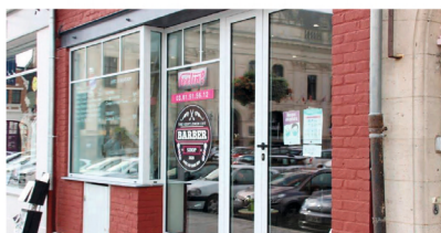
Feeling - Coiffeur