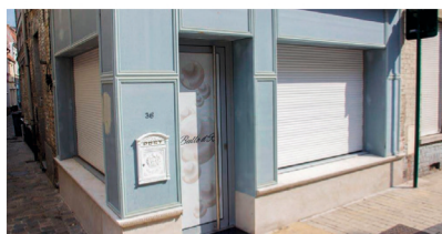
Bulles d'R - Spa