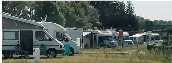
Aire de camping-cars

Le camping municipal a été rénové et réaménagé en 2019 offrant ainsi un plus grand confort aux touristes. En complément, pour répondre à une volonté de revenir à un tourisme plus « local », une aire de camping-cars d'une capacité de dix places équipées de point de vidange et de bornes électriques a été créée. Depuis la réouverture, il y a quelques semaines, nous constatons que l'affluence est là et que ces emplacements sont déjà bien sollicités par les camping-caristes.