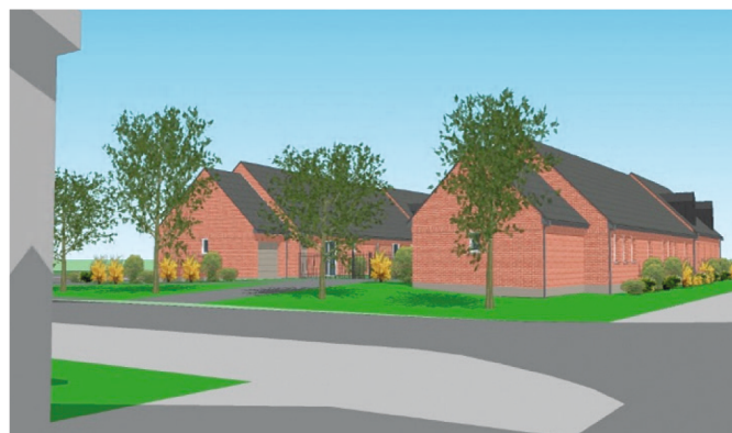
Projet du lotissement

Les services de l'État (INRAP) vont procéder à des fouilles préventives et dès la remise de leur rapport à M. le Préfet, la construction des logements va pouvoir commencer. Ces logements ont reçu un accord sur leur financement malgré le surcoût constaté à l'ouverture des plis du marché l par le constructeur .