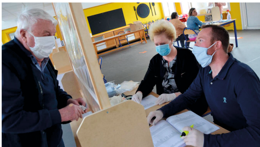
Distribution de masques

Monsieur le Maire et son Conseil Municipal ont proposé de doter tous les airois (enfants, adolescents et adultes) d'un masque en tissu lavable fabriqué par l'entreprise Miditex de Quelmes, entreprise audomaroise.