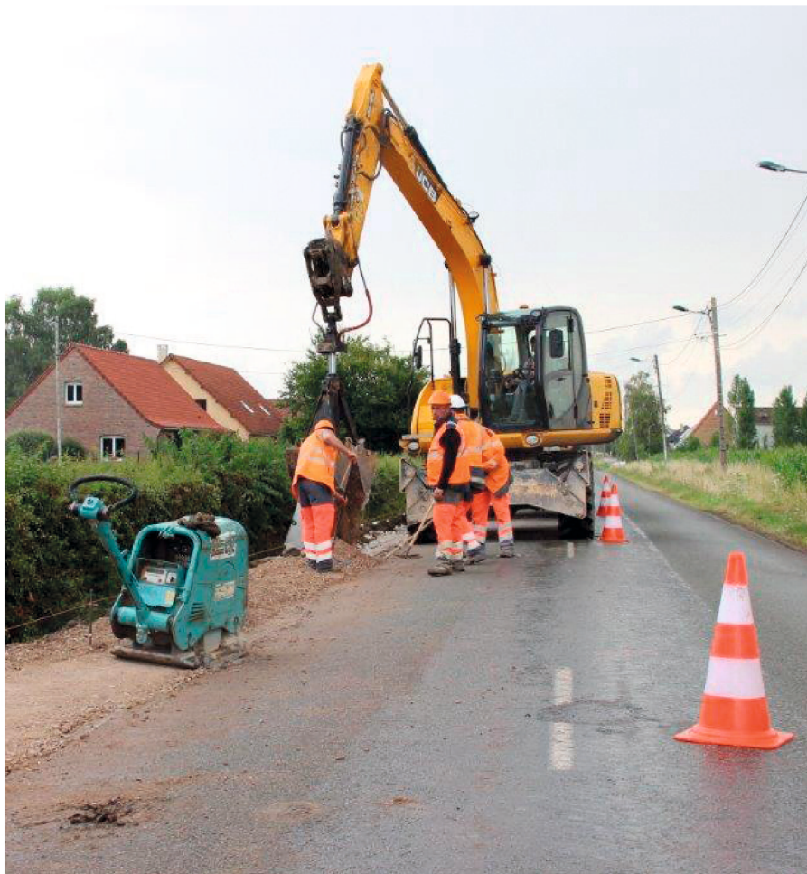
Travaux en cours

Parallèlement, la mise en œuvre des enrobés des chaussées sera réalisée par le Département entre le 24 et 26 août en route barrée avec déviation.