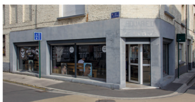
Notorious - Coiffeur