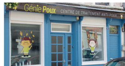
Génie Poux - Anti poux