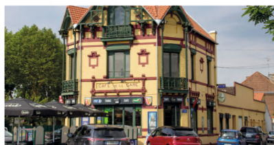
Café de la gare - Bar-PMU