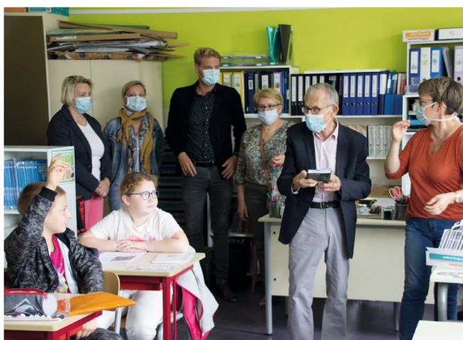
Le Maire avec les représentants élus de l'école Jules Ferry