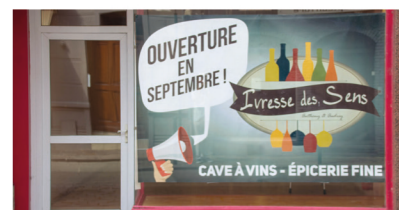
Ivresse des Sens - Épicerie Fine