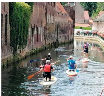
Stand Up Paddle