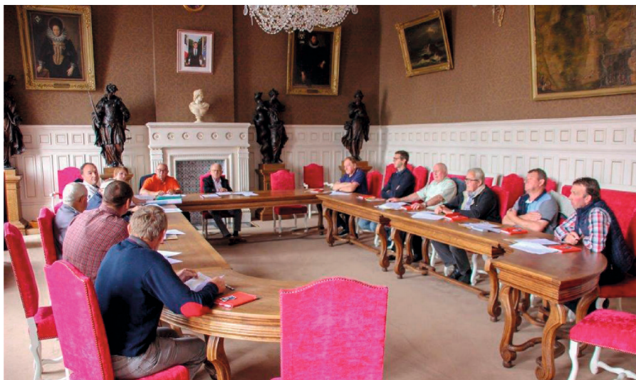
Membres de l'AFR

Un bilan des travaux 2019 a été fait, et les orientations ont été définies pour 2020 avec des échanges fructueux.