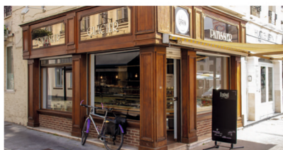
Au p'tit grain - Boulangerie-Pâtisserie