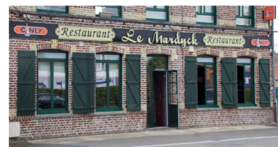
Le Mardyc - Restaurant